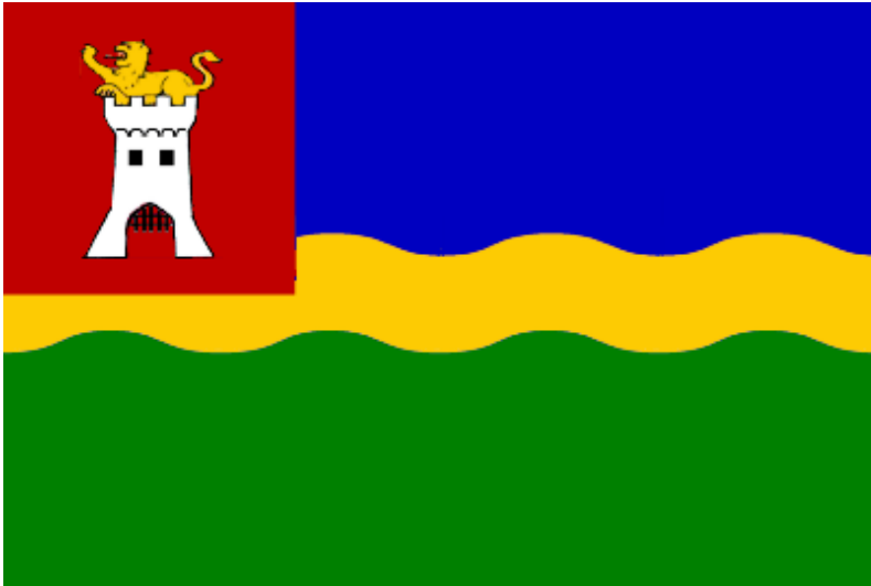
Vlag voor de gemeente Voorne aan Zee, vastgesteld bij gemeenteraadsbesluit van 21 december 2023

Raad gaf de voorkeur aan een meer heraldisch gestileerd hekje. Een gemeenteraadsbesluit tot vaststelling van de nieuwe vlag, die overigens al voor het verzoek om advies in gebruik was, wordt verwacht in 2024.