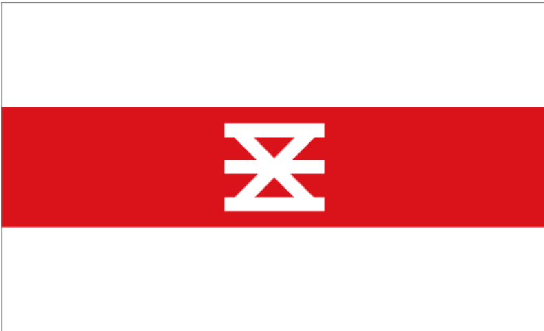
Vlag van de gemeente Enschede

Raad is vastgesteld. In de aanloop naar de viering van het zevenhonderdjarig bestaan van Enschede introduceerden een aantal inwoners en de Stichting Enschede Promotie een alternatieve en in hun ogen meer herkenbare en aansprekende stadsvlag. Hiervoor plaatsten ze in de rode baan de wapenfiguur uit het gemeentewapen, namelijk een slaghek in de vorm van drie dwarsbalken waaroverheen twee schuingekruiste balken.